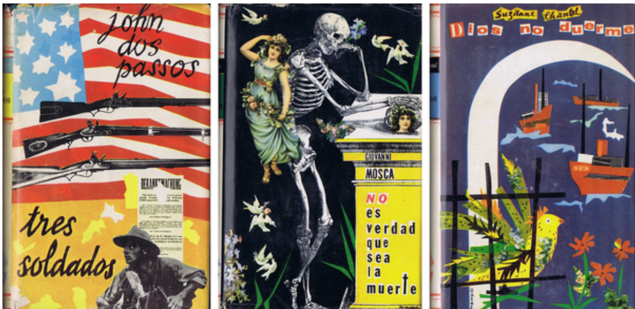
Cobertes de llibres dissenyades per J. J. Tharrats.

Deu àmbits però també 10 cares essencials d'aquesta figura polièdrica en les que trobem maculatures, cartells, llibres, revistes, articles i també una breu però molt representativa selecció de pintures de Tharrats, tant dels períodes més surrealitzants com de les etapes en les que va predominar la pura abstracció matèrica i gestual. Així, només recorrent la mostra i aturant-nos en cadascun dels seus apartats, podrem fer-nos una idea completa de la figura de Tharrats, de l'artista, del promotor d'iniciatives, de l'escriptor i historiador de l'art sempre generós en els seus comentaris sobre els seus col·legues, de l'apassionat per la poesia, inclinació que li desvetllà el seu pare; per la música clàssica i el jazz, que va commoure la seva generació, o el ballet.