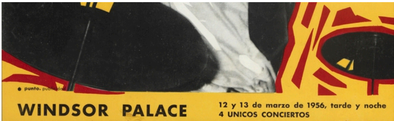
J. J. Tharrats, Lionel Hampton, 1955. Cartell.

Deu àmbits però també 10 cares essencials d'aquesta figura polièdrica en les que trobem maculatures, cartells, llibres, revistes, articles i també una breu però molt representativa selecció de pintures de Tharrats, tant dels períodes més surrealitzants com de les etapes en les que va predominar la pura abstracció matèrica i gestual. Així, només recorrent la mostra i aturant-nos en cadascun dels seus apartats, podrem fer-nos una idea completa de la figura de Tharrats, de l'artista, del promotor d'iniciatives, de l'escriptor i historiador de l'art sempre generós en els seus comentaris sobre els seus col·legues, de l'apassionat per la poesia, inclinació que li desvetllà el seu pare; per la música clàssica i el jazz, que va commoure la seva generació, o el ballet.