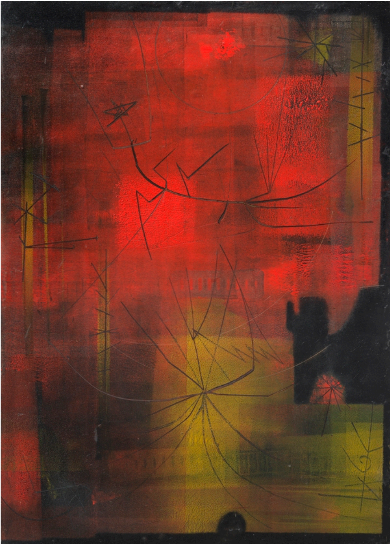
J. J. Tharrats, Maculatura , 1955. Fundació Vila Casas, Barcelona.