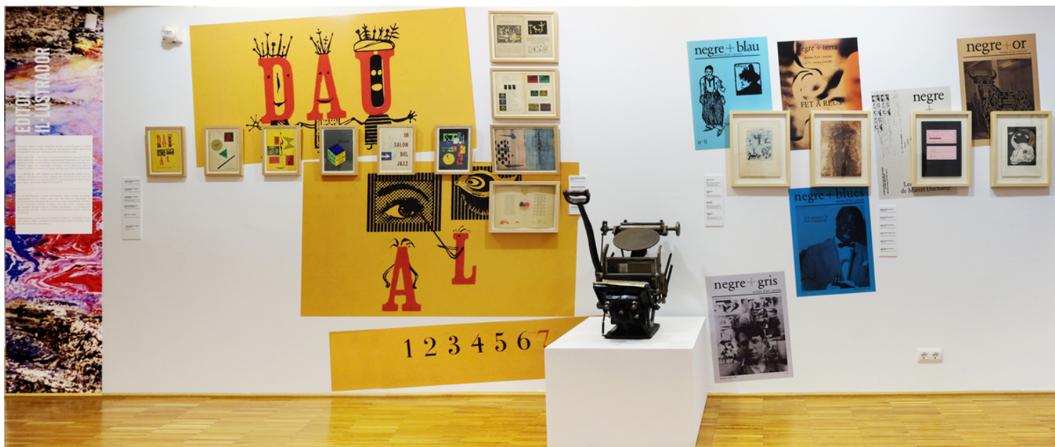
Vista de l'exposició Univers Tharrats .

Precisament, aquesta població s'ha encarregat de preparar el programa commemoratiu en reconeixement al gest que va tenir Tharrats el 1991 quan va decidir donar a la vila tota la seva obra gràfica, col·lecció que custodia la Fundació Tharrats d'Art Gràfic, creada expressament amb aquesta finalitat.